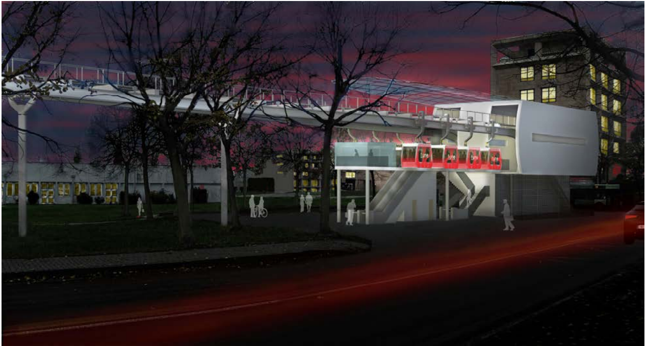
foto-inserimento stazione capolinea