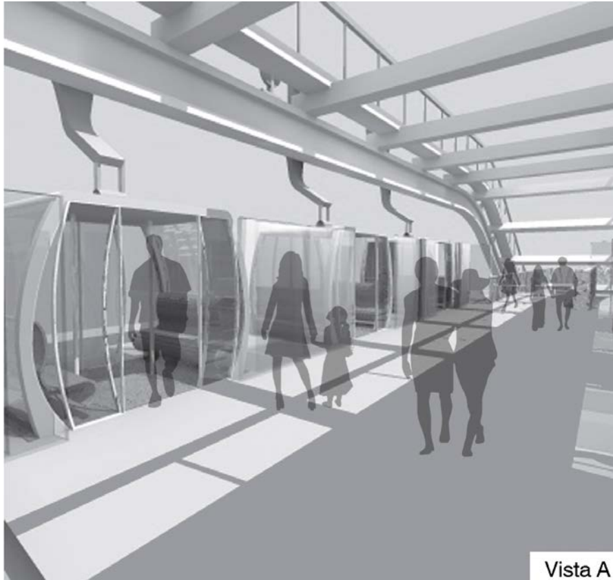
banchina di stazione