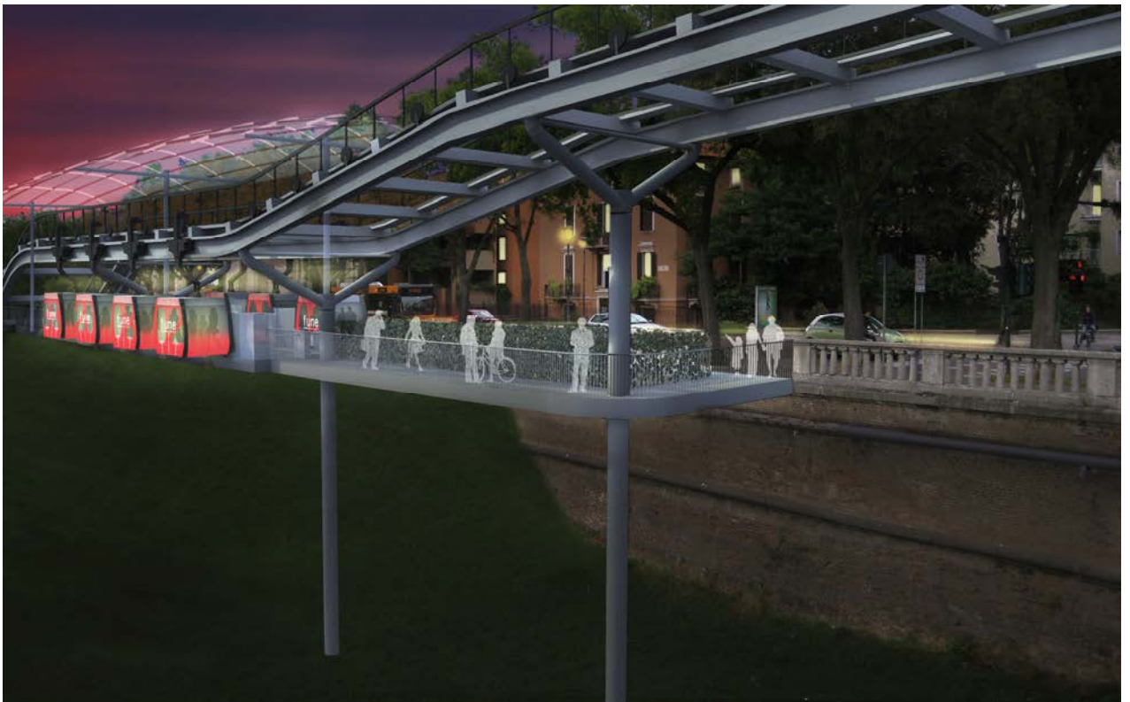
foto-inserimento stazione intermedia