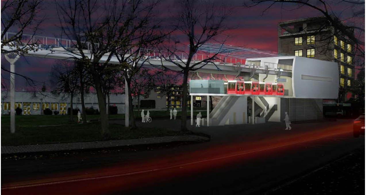
foto-inserimento stazione capolinea