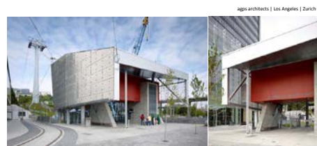
Dar. 9 Talstation | Aerial Tram