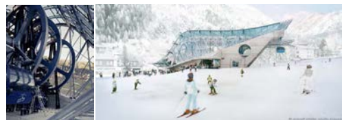
Dar. 6 Georg Driendl | Galzigbahn | St. Anton a.A. 2006