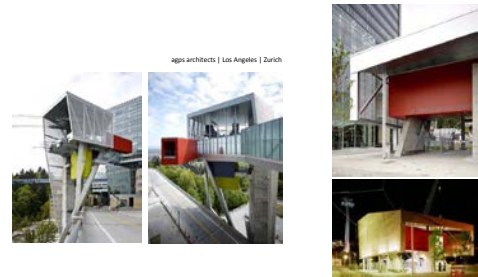
Dar. 12 agps. architecture | Aerial Tram | Portland 2007