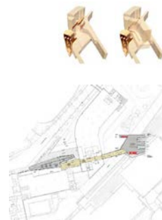
Dar. 10 Bergstation | Aerial Tram