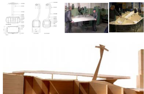
Dar. 11 Kabine und Mittelmast | Aerial Tram

Die Form des Mittelmastes ist in einer Reihe von Modellstudien entwickelt worden. Sie resultiert aber nicht allein aus gestalterischen Überlegungen, eine Vielzahl funktionaler Aspekte wurden bei ihrer Entwicklung mit einbezogen. Die Stütze folgt den hier wirkenden physikalischen Kräften und neigt sich in einem 90° Winkel zu den Seilen der Bahn. Die gewählte Konstruktion aus verschweißten Stahlplatten bildet gleichzeitig die formgebende Hülle des Mastes. Sie ist in der Basis breiter, verjüngt sich nach oben hin, um die Durchfahrtsmaße der Gondeln zu gewährleisten und weitet sich dann wieder auf, um die Kabel aufzunehmen. Die Formung wirkt dynamisch wie auch elegant, der Stadt angepasst.