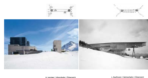
A. Lanzinger | Alhornbahn | Österreich

Ästhetik als Dimension von Nachhaltigkeit