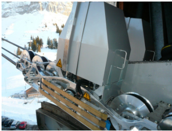
Warnhinweise auf dem Bauteil