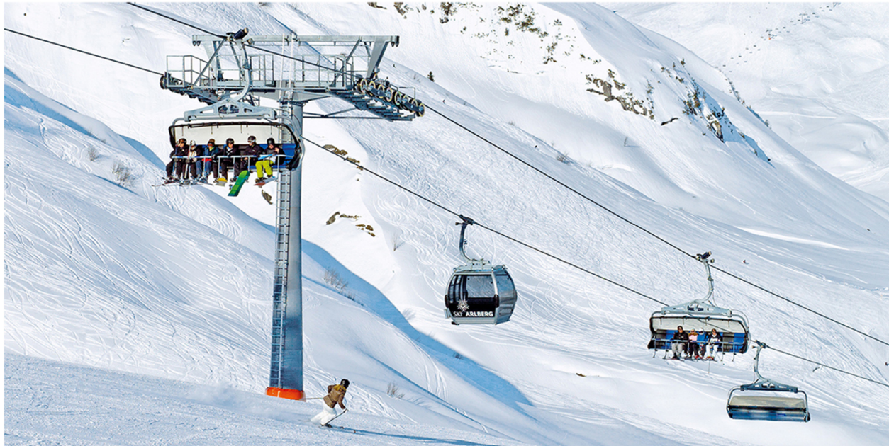
8/10-CGD Weibermahd, Lech am Arlberg